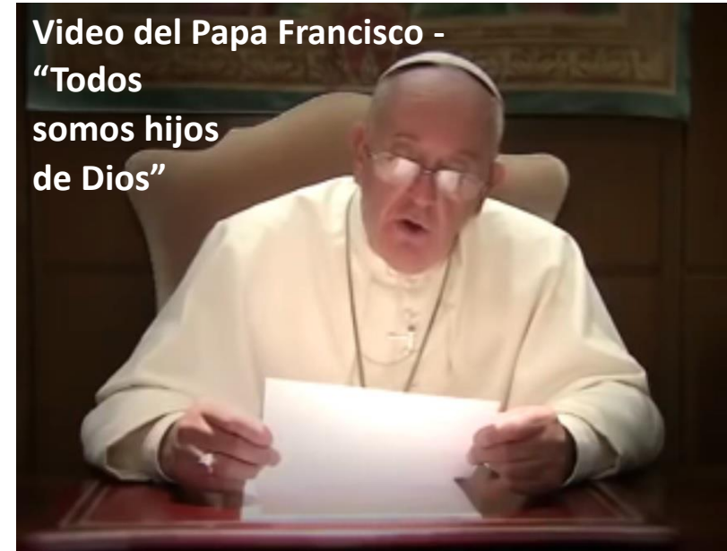
Video del Papa Francisco - "Todos somos hijos de Dios"

"Creo en un solo Señor Jesucristo, Hijo único de Dios... " (Credo Niceno-Constantinopolitano)