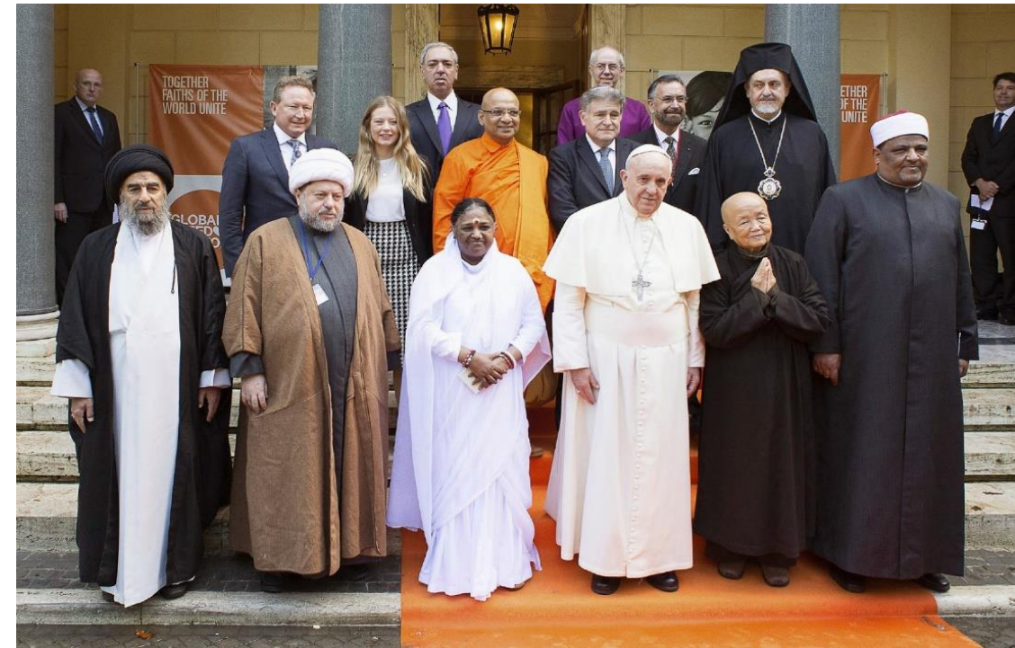
Preparación para el lanzamiento de una Religión Mundial, unificando a todas las creencias para lograr una supuesta paz en la unidad

No hay salvación fuera de Jesucristo. Este video es HEREJÍA y una terrible TRAICIÓN A JESÚS y A SU SANTA IGLESIA CATÓLICA